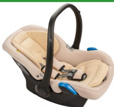
Автокресло группы 0+ для детей массой менее 13 кг