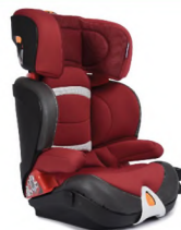
Автокресло группы III для детей массой 22-36 кг (возможно использование бустера)