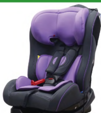
Автокресло группы II для детей массой 15-25 кг