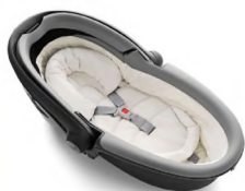
Автокресло «люлька» группы 0 для детей массой менее 10 кг

Детские удерживающие устройства подразделяют на 5 весовых групп: