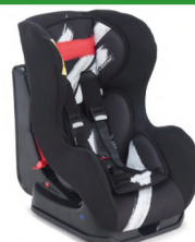
Автокресло группы I для детей массой 9-18 кг